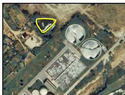
Ejemplos de Depósito de residuos .